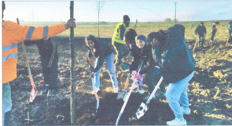
Les collégiens ont plantés les premiers arbres, aidés par dix membres du Lions Club Strasbourg Cathédrale et de trois employés communaux.

Avec la participation du collège du Kochersberg et le soutien de la communauté de commune du Kochersberg et de l'Ackerland, le Lions Club Strasbourg Cathédrale envisage la plantation d'une forêt naturelle à Truchtersheim. Les cent premiers arbres ont été plantés fin novembre.