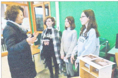
La députée remet les prix à l'équipe gagnante.